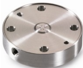
其他产品没有镀膜保护

所有的S6000 系列阀都在其不锈钢定子的工作面涂有DiaDur ( 钻膜 ) 特殊涂层，这种涂层不仅硬度与钻石相当，而且表面极为光滑，能显著改善转子与定子之间的结合缝隙，降低工作面的磨损。