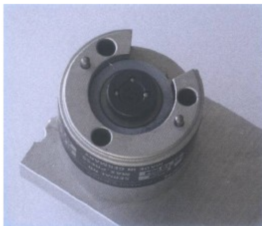
50000次测试后无明显磨损

我们无法为所有的阀给出绝对准确的寿命，因为工作条件、所使用的化学试剂在不同应用中会有很大区别，但对于每只S6000系列的进样阀，Sykam将提供50000次进样的质保期。